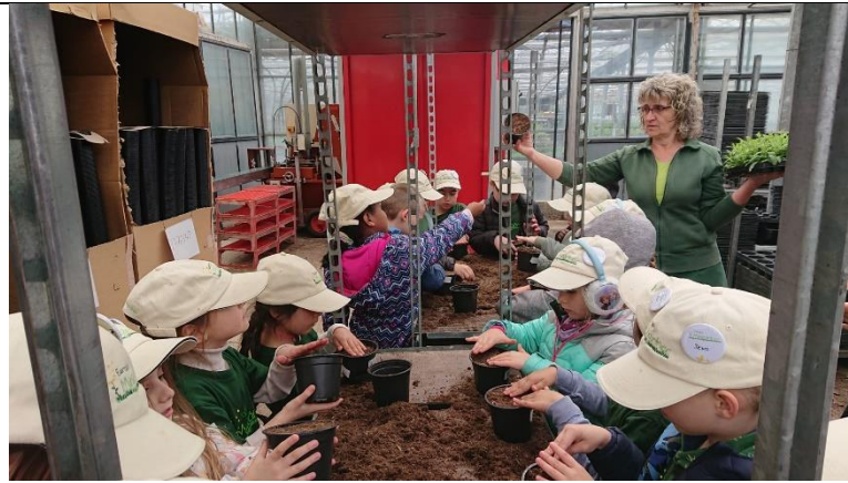
Alle Kinder füllen ihre Töpfe mit Erde