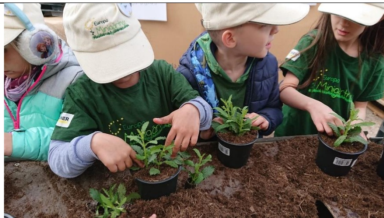
Jetzt wird der Steckling in die Erde gepflanzt