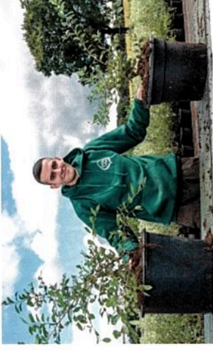
Diese Fotos zum Thema Ausbildung können Sie im Mitgliederbereich der BdB-Webseite herunterladen.