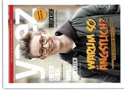
„Schule, Leben, Zukunft: YAEZ zeigt Schülern, wie ein erfülltes Leben geht“, so das Motto des Jugendmagazins. Zu diesem Anspruch gehören auch Berichte und Beiträge zur Ausbildungswahl.

Mit einer Auflage von 360.000 Exemplaren ist YAEZ bundesweit das reichweitertestärkste Jugendmagazin (Erscheinungsweise 6 Mal pro Jahr: 4.200 Auslagestellen). Es richtet sich an Schüler zwischen 14 bis 18 Jahre aus Gymnasien, Real- und Gesamt-